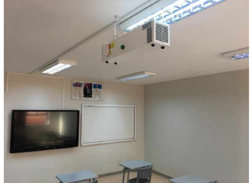
Okulumuzdaki UVC (Ultra Viole C) ışığı ile hava filtre sterilizasyonu cihazları ( Hysafe Air )